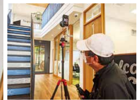
バーチャルオフィス撮影風景