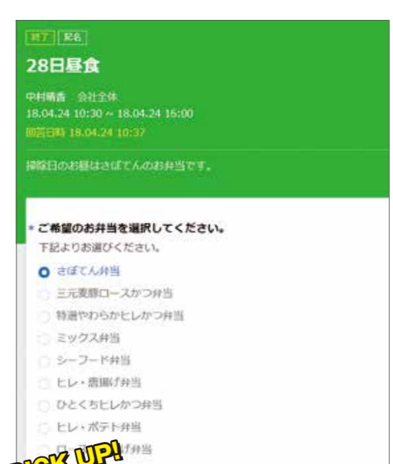
▲弁当の数量確認も自動集計&グラフで楽勝♪