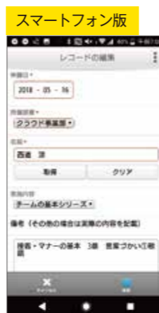
スマートフォン版