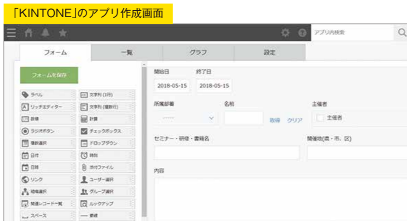
「KINTONE」のアプリ作成画面

純日本製で日本人がわかりやすく、取り組みやすい部品を配置して、設定するだけの簡単な仕組みです。検索やグラフ、CSVにデータを出力する機能は自動的に設定されます。更に弊社がお手伝いさせていただければ、高機能なアプリに拡張することが可能となります。