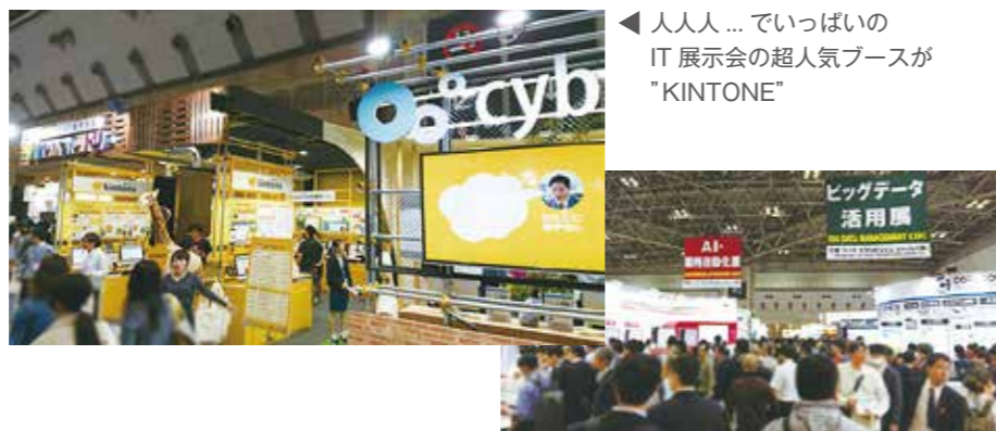
◀ 人人人... でいっぱい IT展示会の超人気ブースが "KINTONE"

最近では、総務のパートタイムスタッフまで自分でアプリを作り始めるなど改善意識が高まっています。まずは80%の完成度で使い始め、問題点を早い時点で洗い出し、残り20%をプログラマー陣に調整や機能追加をお願いして業務の活用度を向上させていく手法は、高速にPDCAサイクルを回すことにつながり業務改善、そしてコスト削減に大きな効果があります。業務改善にご興味がありましたらご検討ください。