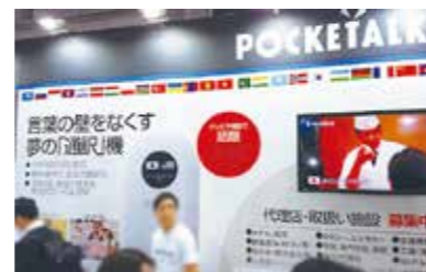
▲ITWEEK の展示ブースでも注目度は高く人だかりができていました。

実際に手に取って翻訳させると、日本語→英語を、サクサク翻訳してくれる「POCKETALK」に周囲からも驚きの声があがっていました。そんな翻訳アプリで簡単にできるよって声もありますが、双方向翻訳の場合は外国人にも操作していただく必要があるため、誰もが使いやすい端末が必要です。翻訳専用端末はボタンの数が少なく、操作も容易で子供から高齢者まで訓練せず、誰でも圧倒的に使いやすいのです。「POCKETALK」なら月々僅かな料金で、店頭やカウンターに手軽に使える、いざという時の 1 台として翻訳端末が設置可能になります。