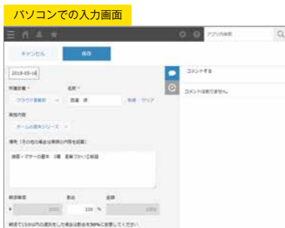
パソコンでの入力画面